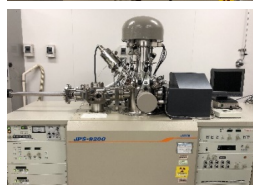
オージェ電子分光装置 (AES、JAMP-9500F)